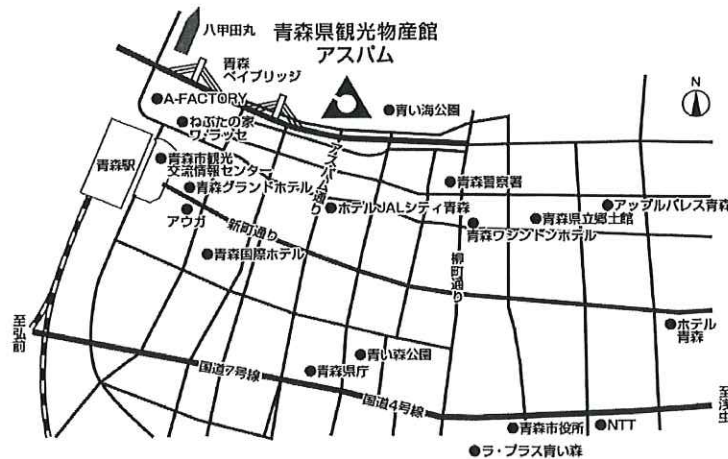
青森県観光物産館アスパム 青森市安方1-1-40